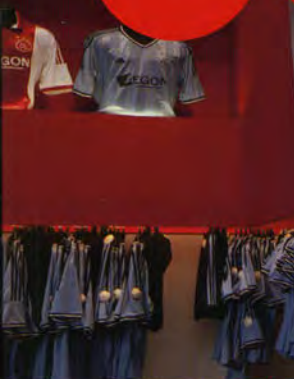
1911 AJAX PROMOVEERT NAAR DE EERSTE KLASSE