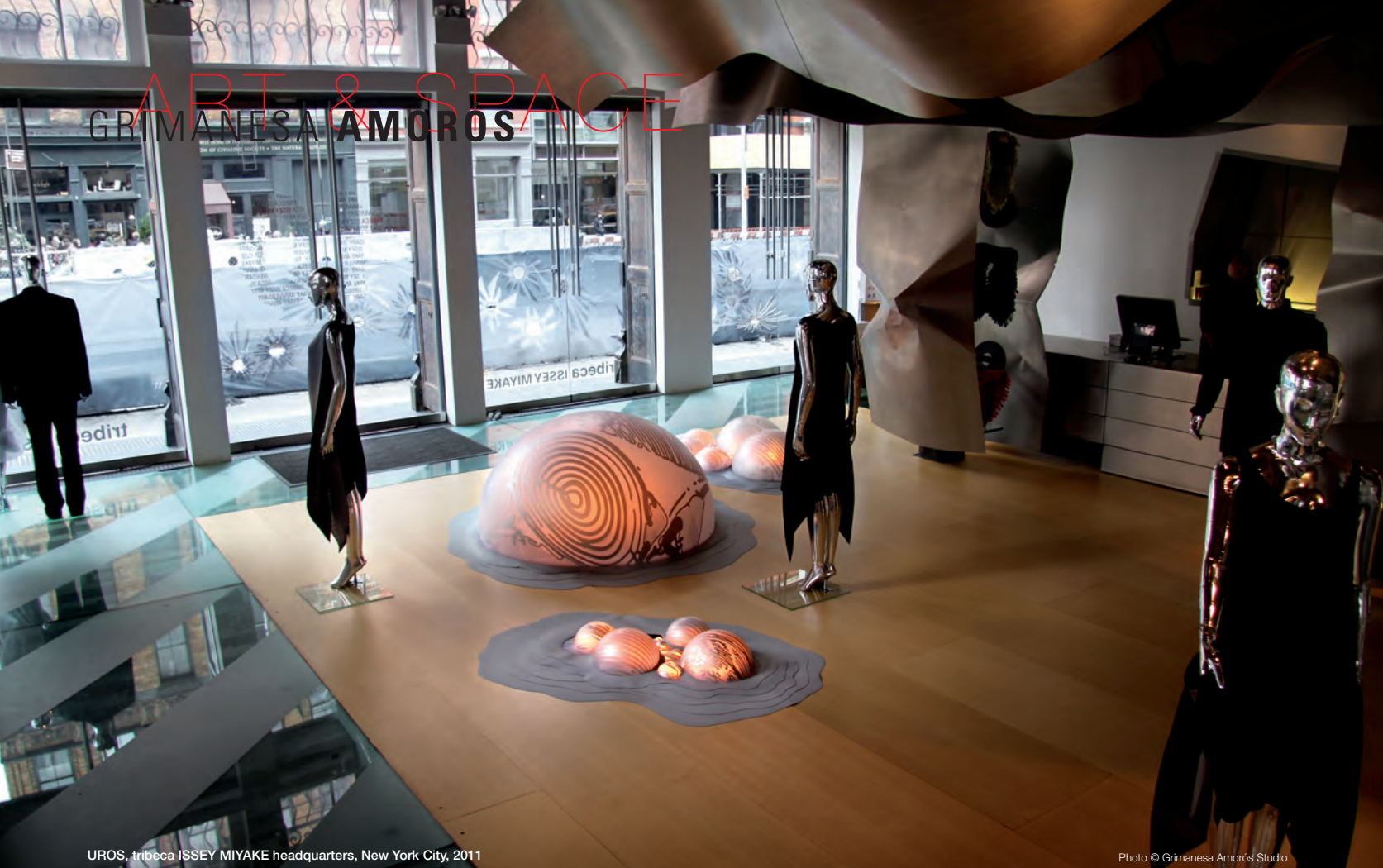
UROS, tribeca ISSEY MIYAKE headquarters, New York City, 2011