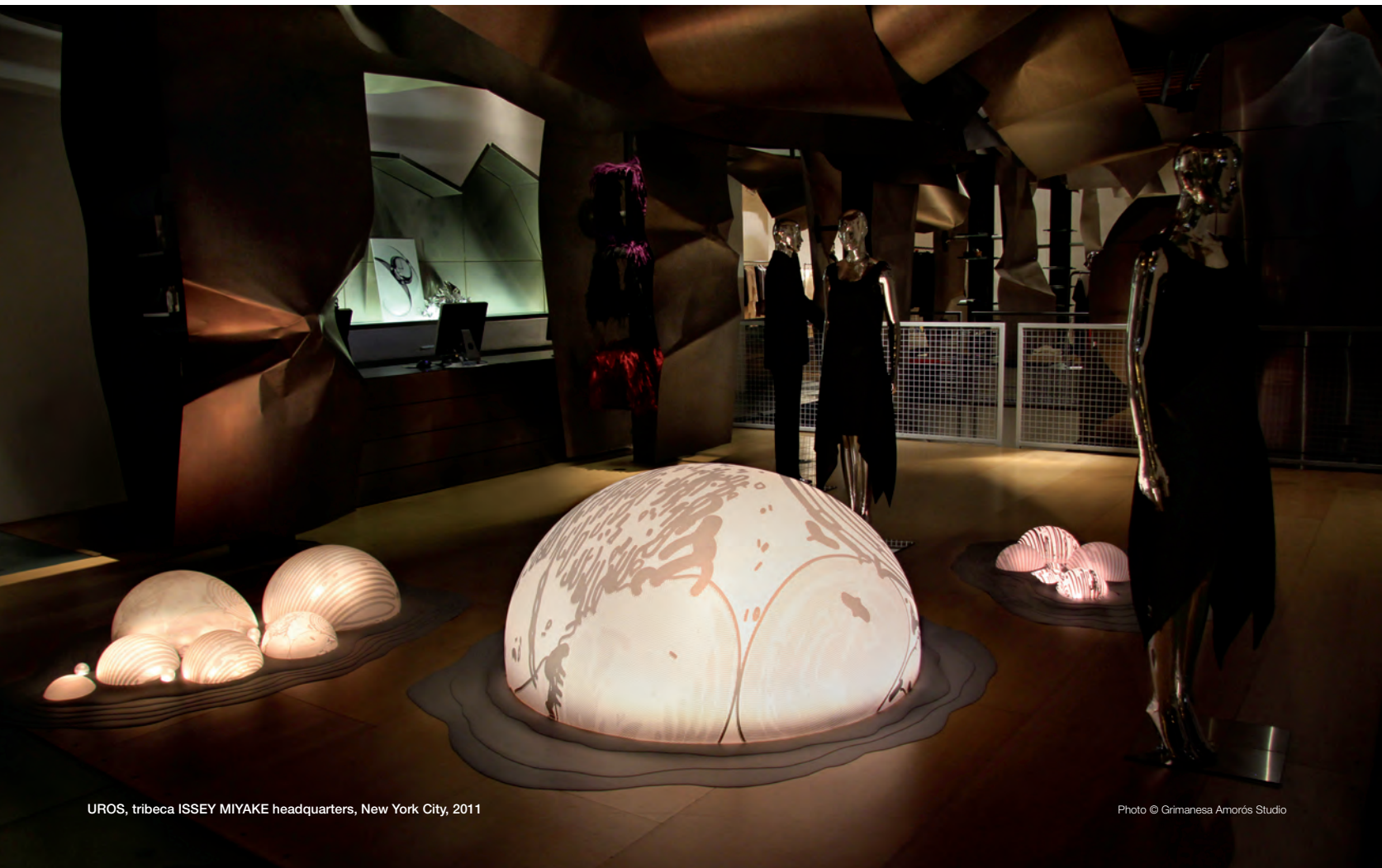
UROS, tribeca ISSEY MIYAKE headquarters, New York City, 2011